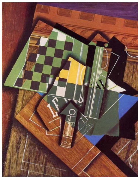
J. Gris, La scacchiera, 1915 olio su tela, Art Institute of Chicago

effetti terribilmente disastrosi sia sul benessere che sulla sicurezza nazionale americana. Sempre secondo lo stessa analisi, il fallimento del TPP, cui si oppongono i due antagonisti, incoraggerebbe la Cina ad esercitare un ruolo dominante nella regione Asia-Pacifico per quanto riguarda sia le questioni commerciali che diplomatiche. Il mancato accordo metterebbe in discussione l’affidabilità degli USA ed il loro impegno nella regione, anche in materia di sicurezza. Ma le proposte di Donald Trump sono ulteriormente dannose per gli interessi americani e mostrano di non comprendere a fondo la natura degli accordi militari e le implicazioni sul budget. Esse potrebbero sia essere un costo per la nazione che distruggere il sistema di alleanze create negli anni, attraverso il quale gli USA hanno esercitato la propria influenza ed il loro potere. Le minacce di abbandonare i Free Trade Agreement (FTA) potrebbe danneggiare gli Stati Uniti e destabilizzare i rapporti con gli Stati arabi moderati e le nazioni latino americane. Nello specifico, se il NAFTA dovesse essere abrogato, i danni per un paese come il Messico sarebbero notevoli, tali da cancellare i